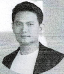
ศ. ดร.สุชัยวีร์ สุวรรณสวัสดิ์ อธิการบดีสถาบันเทคโนโลยี พระจอมเกล้าเจ้าคุณทหารลาดกระบัง

16 - 17 สิงหาคม 2567 ณ กกม. 22 - 24 สิงหาคม 2567 ณ ระยอง และชลบุรี 2 - 7 กันยายน 2567 ณ เครือรัฐออสเตรเลีย 13 - 14 กันยายน 2567 สรพผล ณ กกม. หรือ ปริมณฑล